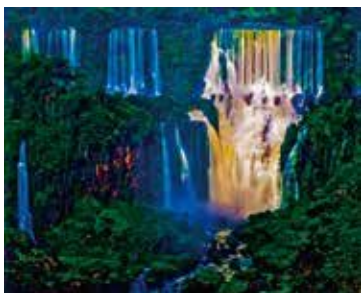
《イグアス、ポゼッチ滝、アルゼンチン》