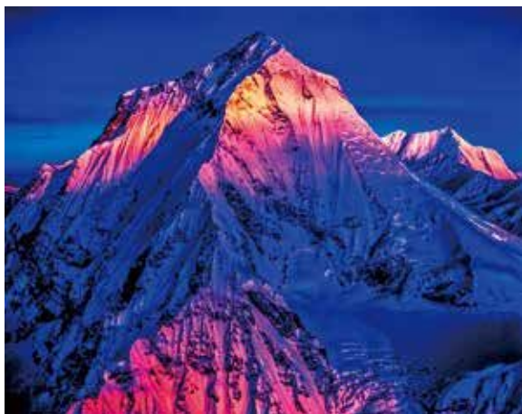
《ダウラギリ峰、ネパール》