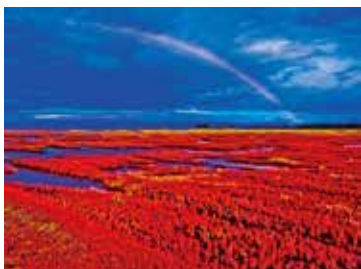
《能取湖、サンゴソウ、日本》