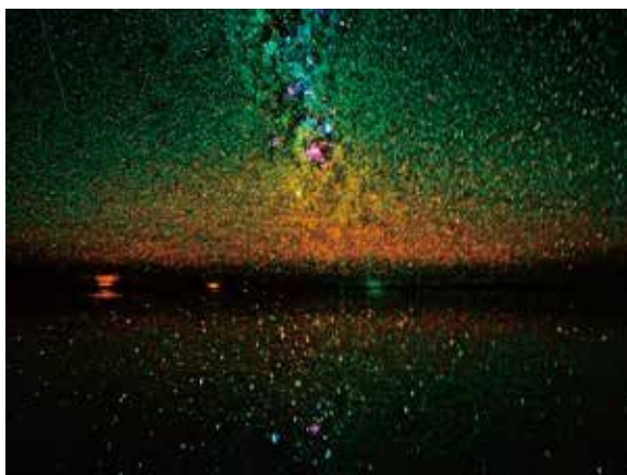
《ウユニ塩湖の星、ボリビア》