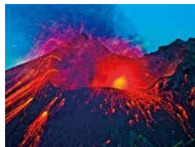
《桜島夜明けの噴火、日本》