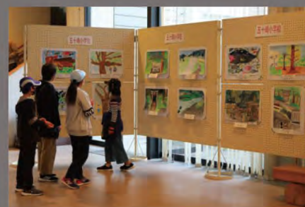
展示イメージ (五十崎文化祭)