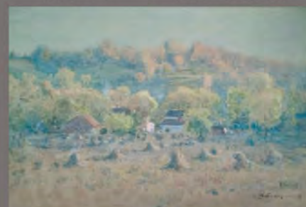
中川八郎 《田舎の秋》1904年