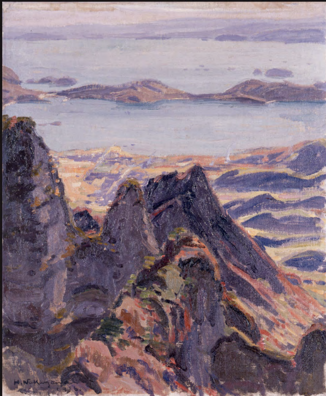
《寒霞溪四望眺より》1916年