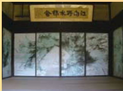
井出創太郎「渡部家住宅 その光と記憶」2006年