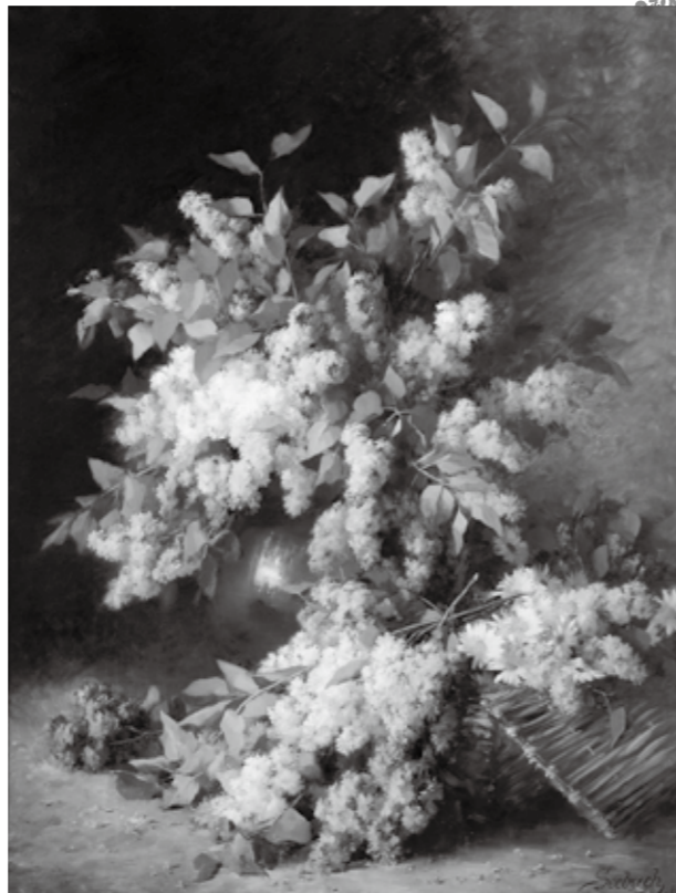
ロタール・フォン・ゼーバツハ《リラの花束》1894年 136.5×107cm ストラスブール美術館蔵