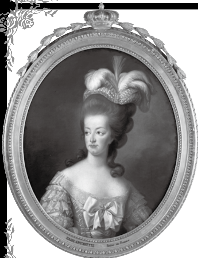
ヴィジェールブラン《王妃マリー・アントワネット》1778年 81×65cm ブルトゥイユ城蔵