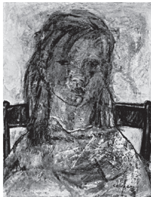
古茂田守介「少女」1947年、愛媛県美術館