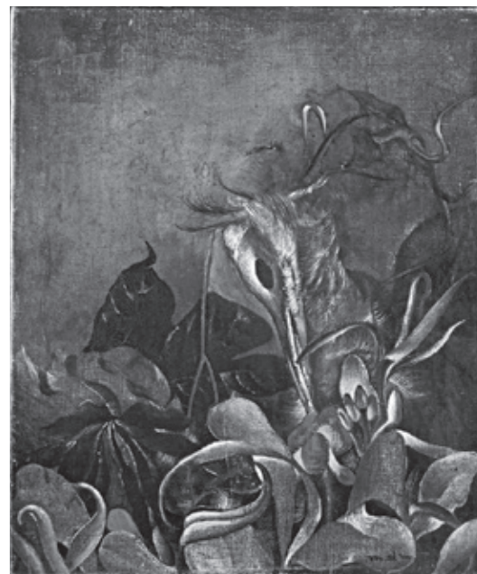
観光「鳥」1942年頃、宮城県美術館