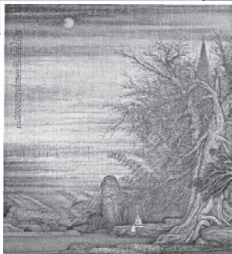
矢野鉄山「孤琴清澗」

今回の展示では、近代日本画史の主流からは少し異なるかもしれない領域にも目を向け、明治・大正・昭和の流れをたどります。季節に合わせて春の花の絵も並べますので、花見がてら御覧いただければ幸いです。(S.K.)