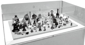
何ともかわいらしい真鍋博収集のベルたち

これらのニューカマーたち、今後それぞれに調査研究や定期的な展示公開を重ねていくことで、当館の重要な「顔」の一つになっていくことでしょう。(T.N.)