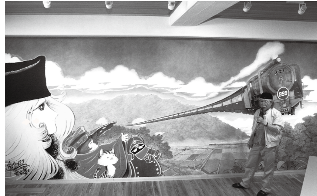
大洲市立新谷小学校 壁画除幕式(2012年7月)