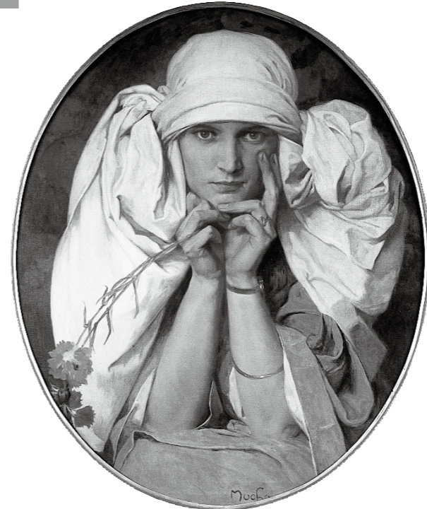
アルフォンス・ミュシャ(ヤロスラヴァの肖像) 1927-35年頃 油彩・カンヴァス 73x60cm ミュシャ財団蔵