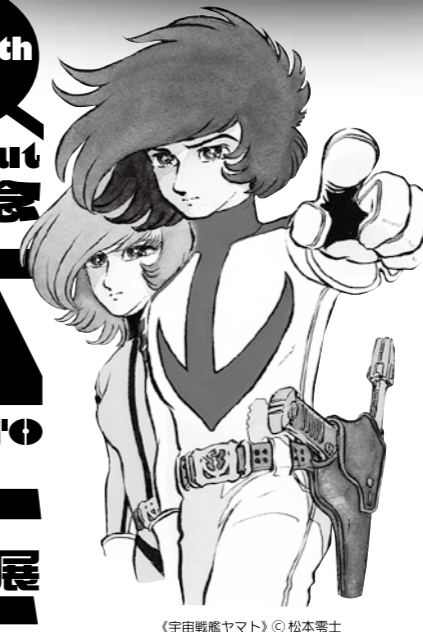
(宇田戦艦ヤマト) © 松本零士