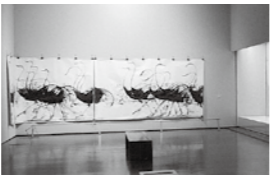
横幅8メートル! 壮大な福井江太郎作品