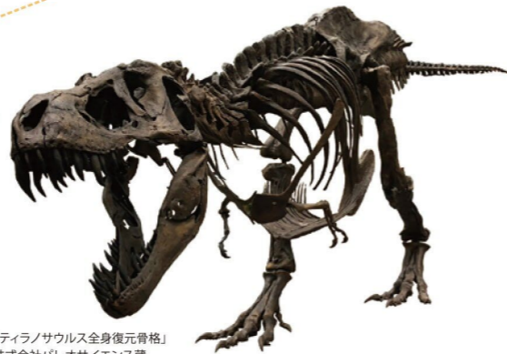
「ティラノサウルス全身復元骨格」株式会社ハレオサイエンス蔵

大型肉食恐竜の中でも特に知名度の高いティラノサウルスは、後期白亜紀に北アメリカ大陸に生息していました。本展では迫力ある全身復元骨格や最新の研究成果を通してその魅力を紹介します。合わせて愛媛大学研究チームが県内で初めて発掘した首長竜の歯とみられる化石を、期間限定(8/11～28)でご紹介する他、愛媛県総合科学博物館の協力で県内産出の化石も展示します。(杉山 はるか)