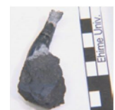
「首長竜の歯の化石」愛媛大学蔵