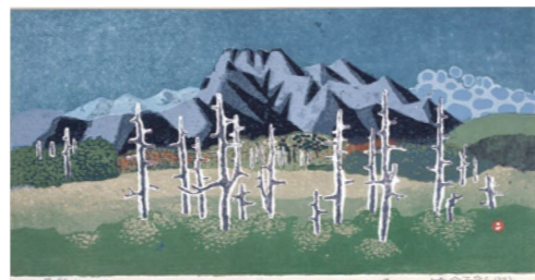
畦地梅太郎《石鎚山》1985(昭和60)年

初めての版画集「伊予風景」に収められた《石鎚霊峰》から、最後の版画とされる愛媛県民文化会館サブホールの緞帳原画《石鎚山》まで、畦地の版画への思いがその時々の石鎚山に表されています。また、こうした畦地作品とおして石鎚山の魅力を再発見していただきたいと思えます。会期中には、石鎚山の美しい映像とVR(バーチャルリアリティ)体験が、一緒に楽しめる「VR情報発信ボックス」も会場内に設置いたしますのであわせてお楽しみください。(喜安 嶺)