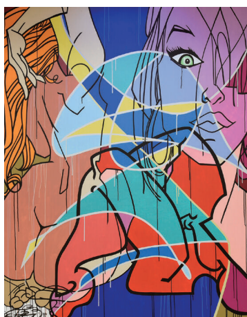
Pro 176 《Astro Anatomy》2011, Acrylic on canvas ©Artrust - Courtesy of the artist

本展では、グラフィティ時代の先駆者たちの作品から始まり、グラフィティアートとファインアートの橋渡しをしたヘリングやバスキア、ヨーロッパや日本にて活躍するストリートアーティストまで、バンクシー作品を含む約90点を紹介します。社会的・文化的背景をもとに生まれ、いまなお進化を続けるストリートアートの歴史と本質に迫ります。