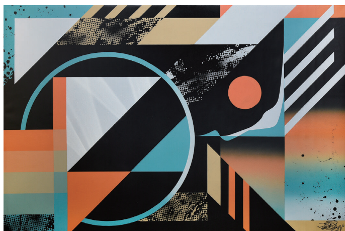
Truly Design 《Akira》2023, Acrylic and spray on canvas