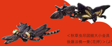
<秋草虫尽図罎大小金具 銘 後藤法橋一栗(花押)>より目買 後藤一栗 江戸時代 佐野美術館蔵