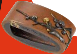
<桜梅水仙図罎罎頭 銘 (縁)一宮長常(花押)> より縁 一宮長常 江戸時代 佐野美術館蔵