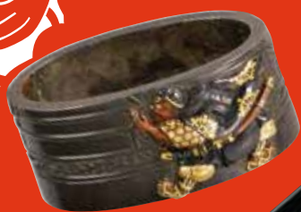
<道成寺物語図罎罎頭 銘 大森英秀(花押)>より縁 大森英秀 江戸時代 佐野美術館蔵