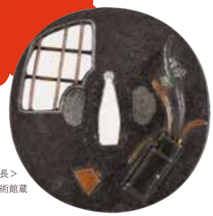
<茶席図罎 銘 西陣住人/埋忠重長> 江戸時代 佐野美術館蔵