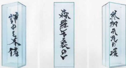
「書のキュビズム」 「静めと不屈」(左) 「森羅万象の一」(中) 「終初天地の環」(右)