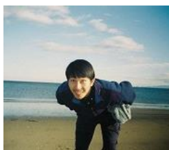
浅田政志 Masashi Asada

写真家。1979年、三重県生まれ。自らも被写体となった家族写真集『浅田家』（赤々舎刊）で第34回木村伊兵衛写真賞を受賞。日本各地の市井の人々を撮影するプロジェクトにて精力的に活動をしている。主な展示は、『Tsu Family Land 浅田政志写真展』（2010年：三重県立美術館／個展）、『LOVE 展』（2013年：森美術館）、『ほぼ家族。』（2016年：入江泰吉記念 奈良市写真美術館／個展）。