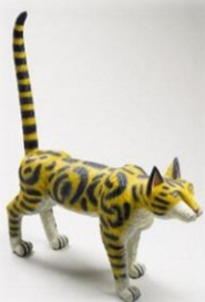
三沢厚彦 《Cat 2013-03》2013年 樟、油彩

一般からの問い合わせ先：「坊っちゃん展」実行委員会事務局(テレビ愛媛事業部内) Tel.089-933-0322(9:30～17:00 土日・祝日を除く)