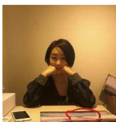
梅佳代 Kayo Ume

写真家。1981年、石川県生まれ。「男子」「女子中学生」シリーズで、キヤノン写真新世紀連続受賞。2006年、初写真集『うめめ』（リトルモア）で木村伊兵衛写真賞受賞。13年、東京オペラシティアートギャラリーで個展『梅佳代展 UMEKAYO』を開催。近著に『白い犬』（新潮社）、『ナスカイ』（亜紀書房）。日常の中に潜んでいる様々な光景を独自の観察眼で捉えた作品が高く評価され、国内外の媒体や展覧会で作品を発表している。